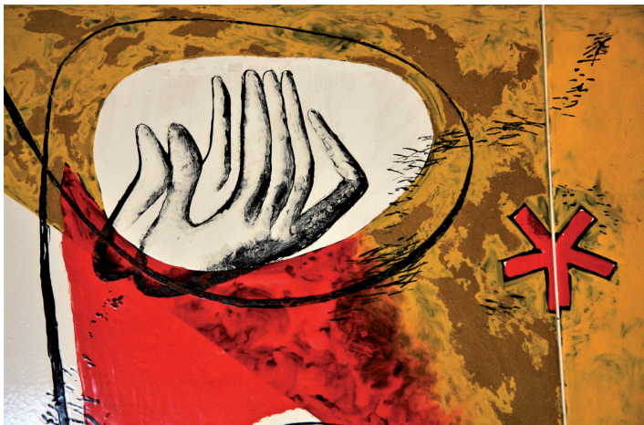
Dessin de Le Corbusier sur portail chapelle

De 14h à 15h : Samedi 4 octobre. Samedi 11 octobre. Samedi 18 octobre. Samedi 25 octobre.