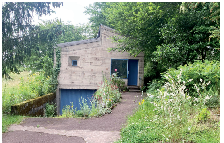
Maison du chapelain, Le Corbusier